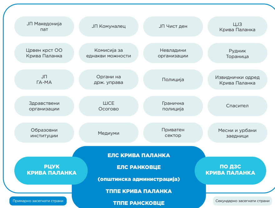
Мапа - Преглед на примарно и секундарно засегнати страни

Последователно, на мапата подолу е даден прегледот на примарно и секундарно заинтересираните страни на подрачјето на двете општини.