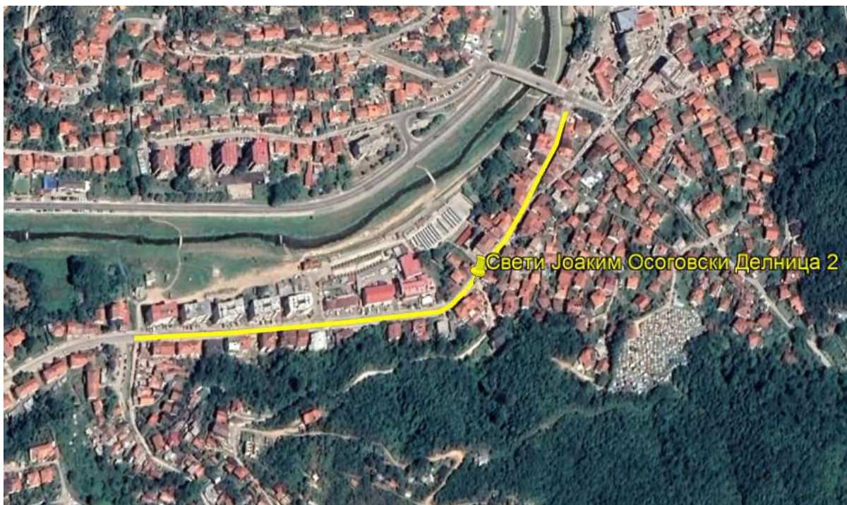
Слика 3 Делница 2 од локалната улица „Свети Јоаким Осоговски“

Делница 2 од локалната улица „Свети Јоаким Осоговски“ има ширина од 7 m и должина од 542,50 m. Започнува од крајот на Делница 1 и завршува 542,50 m западно од почетокот. Вдолж улицата има главно куќи, станбени згради и локални продавници. Улицата е оштетена со надолжни и попречни пукнатини, како и ударни дупки на неколку места.