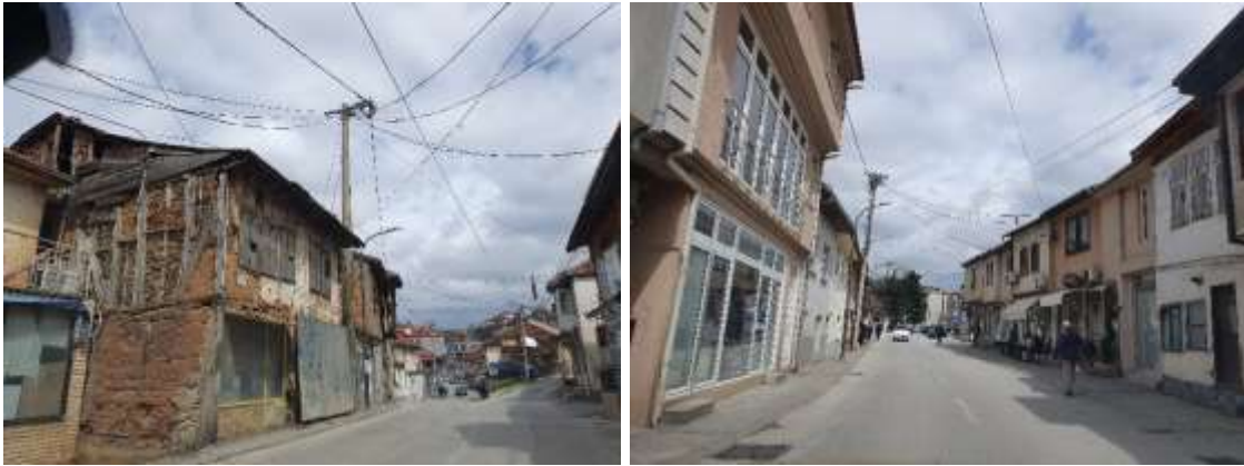
Слика 5 Направени фотографии на Делница 2 од улицата „Свети Јоаким Осоговски“ за време на теренската посета на 05.04.2023 година

Согласно Законот за животната средина, овој проект припаѓа во поглавје XI – Инфраструктурни проекти, точка 1 – Рехабилитација на локални улици, поради што е потребно да се изработи Елаборат за заштита на животната средина и истиот да биде одобрен од страна на Општината.