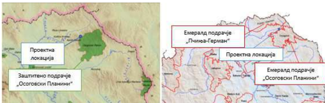
Слика 6 Заштитено подрачје „Осоговски Планини“ и Емералд подрачје „Пчиња-Герман“ и „Осоговски Планини“