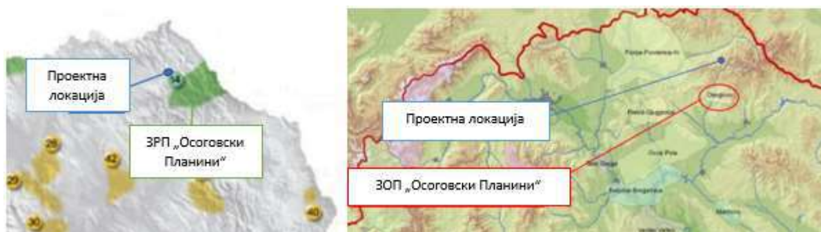
Слика 7 Значајно Растително Подрачје и Значајно Орнитолошко Подрачје „Осоговски Планини“