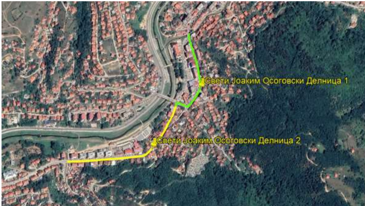
Слика 1 Делница 1 и Делница 2 на локалната улица „Свети Јоаким Осоговски“

1) и 542,50 m (Делница 2). Согласно Основниот проект, ширината на улицата е 7 метри и е со две ленти. Во проектот се предвидува и изградба на тротоари.