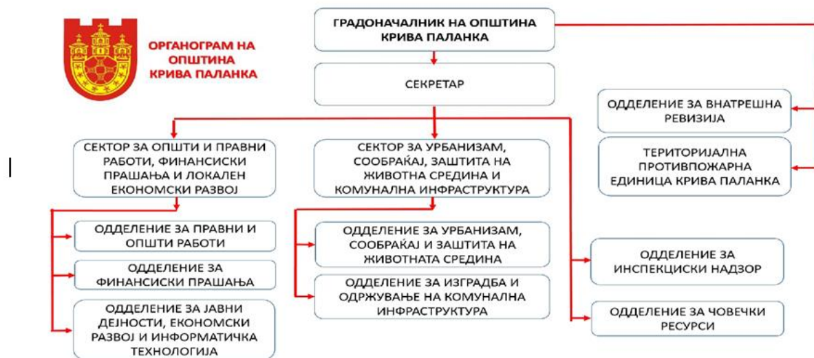
Слика бр. 1 – Организациска структура на општина Крива Паланка

Во ЈП Комуналец работат вкупно 88 вработени, распоредени во 5 сектори.